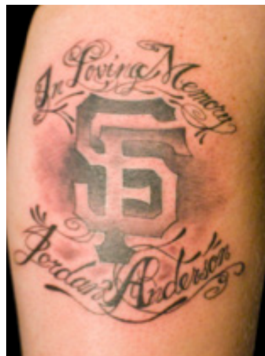
Figura 4. Fotografía del usuario Mez Love, tatuaje-recuerdo (SF Memorial).

El cuerpo es (re)apropiado a través de la gráfica, que lo activa desde aquella significación que se niega a ser solo “piel sin marcar” para ubicar su relato dentro de la circulación pública. De este modo, reclama ser visto como panóptico invertido (Garrido, 2010) y se metaforiza en posesión del mundo, comunicándolo mientras lo habita, lo recuerda y lo significa. Es decir, el tatuaje propone la carne como unidad discursiva atípica, se alza como voz indómita al curso oficial para dar lugar a la expresión de sentimientos, ideas y recuerdos. En analogía al mundo editorial, cuando alguien se llena la piel de dibujos, como anuncian Corci y Mayer (1998), ofrece una discontinuidad similar a las palabras, pues solo cuando sumamos los fragmentos que el cuerpo soporta comprendemos que este es un lugar común para textos complejos provenientes de diferentes imaginarios y fuentes.