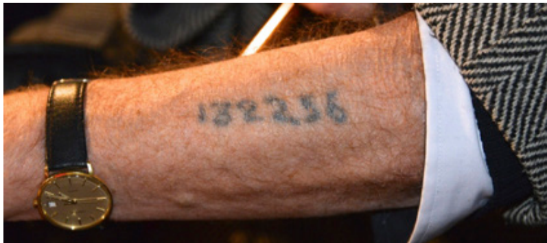
Figura 3. Tatuaje con número identificador de superviviente, Ceremonia del Día Internacional del Recuerdo del Holocausto en la plaza Raoul Wallenberg, Estocolmo en el año 2013.

sus compromisos existenciales o la ausencia de los mismos y asegura un sentido de trascendencia ontológica. El cuerpo es su identidad subjetiva. (p.184).