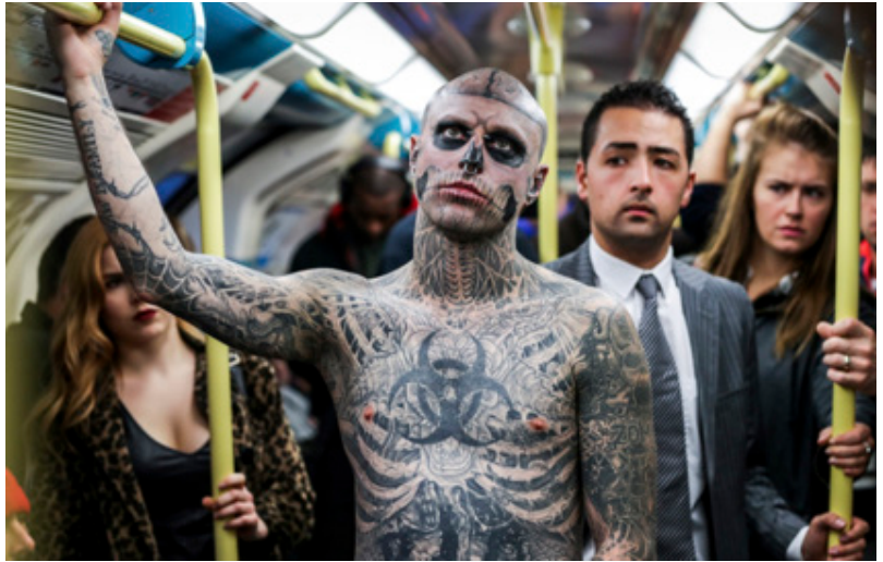
Figura 5. Fotografía de Rick Genest “Zombie Boy” en Londres en octubre de 2016, en el lanzamiento de Platform 15 , nueva atracción del terror de Thorpe Park para la celebración de Halloween . “Zombie Boy” se tatúa en su superficie precisamente el interior, lo que es adentro es afuera y viceversa.

3. Este huir y guarecerse del olvido no ha de significar necesariamente una traducción o transducción fiel y verídica de aquello que sirvió para la figuración. Por el contrario, la individualidad y la subjetividad de las experiencias dejan paso a la imaginación y el deseo, por lo que el tatuaje es una expresión y dotación de sentido de un mundo –ni siquiera todos los mundos posibles–, y además, en su polisemia sirve a diversos trazados de la narración y en su metáfora a la apertura de su sentido.