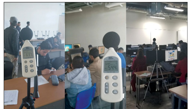
Figura 2. Estudio de ruido en aulas en uso.

Para la segunda etapa se solicitó la autorización al docente a cargo de las clases para ingresar al salón, explicándole previamente en qué consistía la prueba y el objetivo con el que sería realizado el estudio, así como indicándole que la clase debía continuar su curso de forma normal como siempre la lleva a cabo. Después de tener la anuencia para entrar al lugar, se tomaron los datos correspondientes con la clase en curso (Figura 2). Cabe mencionar que al realizar la toma de datos en los salones con clase, había 30 personas en cada una, ya que es la capacidad máxima de dichas aulas.