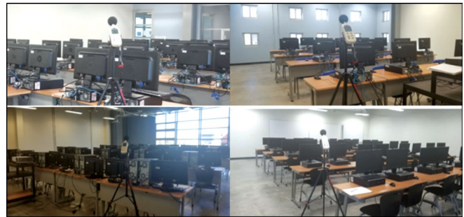
Figura 1. Estudio de ruido en aulas vacías.

Ubicando el sonómetro como se observa en la Figura 1, se procedió a obtener las lecturas arrojadas por el instrumento, que fueron videograbadas a través de un teléfono celular, para posteriormente ser apuntadas en el formato diseñado para el registro de niveles en prueba de ruido. En la figura antes mencionada se pueden ver algunas de las pruebas realizadas en salones desocupados.