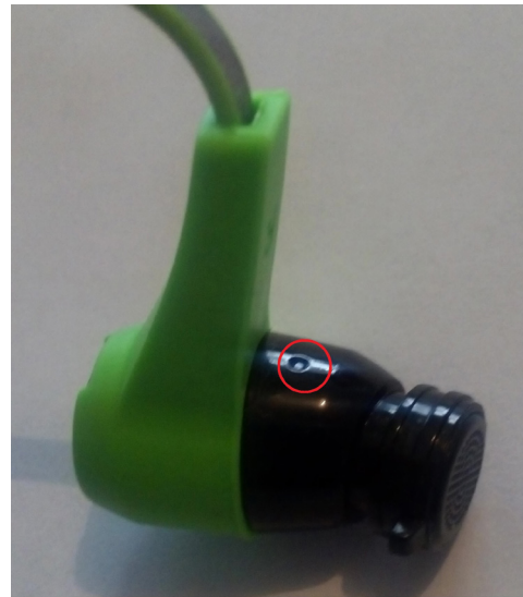
■ Figura 4. Posición de la señal lumínica de encendido en los audífonos inalámbricos.

Figure 3. A relief letter identifying the side of the tip.