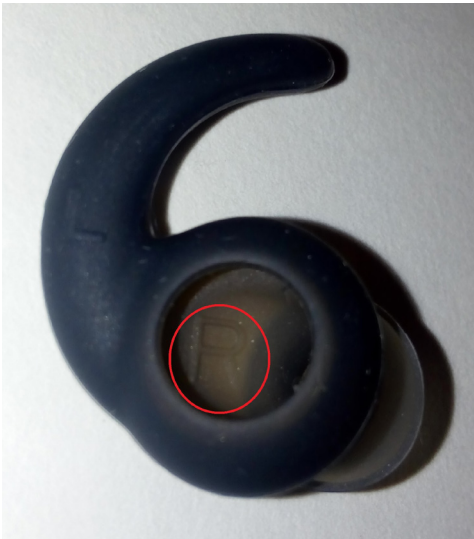
■ Figura 3. Letra en relieve que identifica el lado de la punta.

Figure 3. A relief letter identifying the side of the tip.