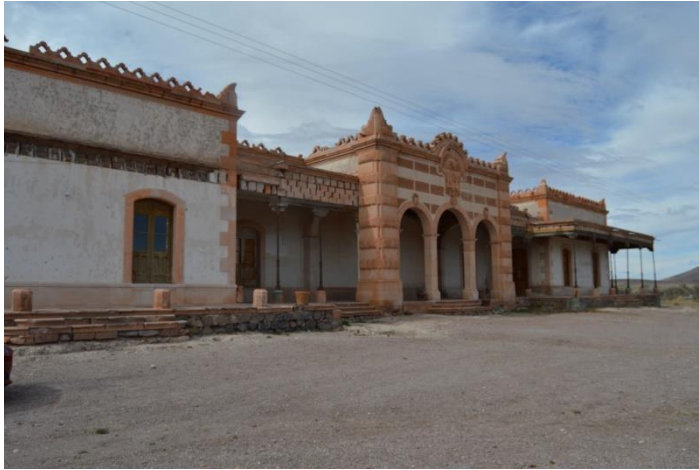
Fachada de la hacienda