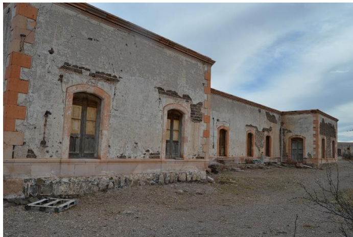
Parte trasera del edificio

Fotografías tomadas por Fátima Herrera, Hacienda de San Diego, 05 de mayo del 2017