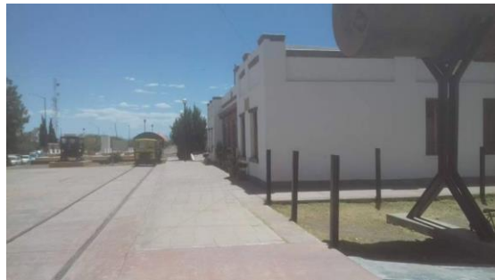
Exterior del edificio