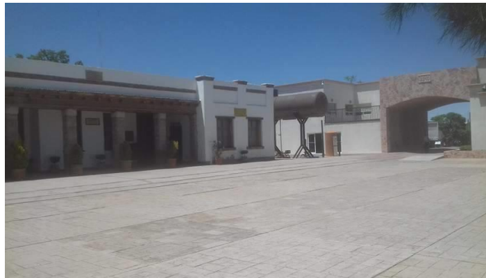
Vista del complejo