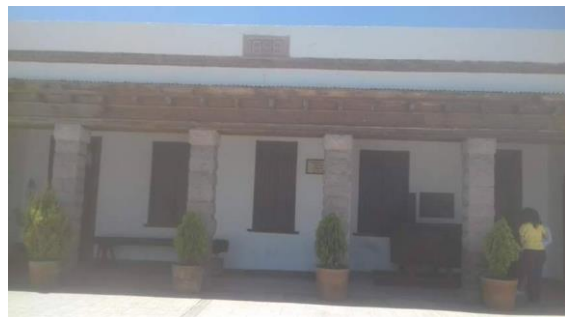
Exteriores de las oficinas