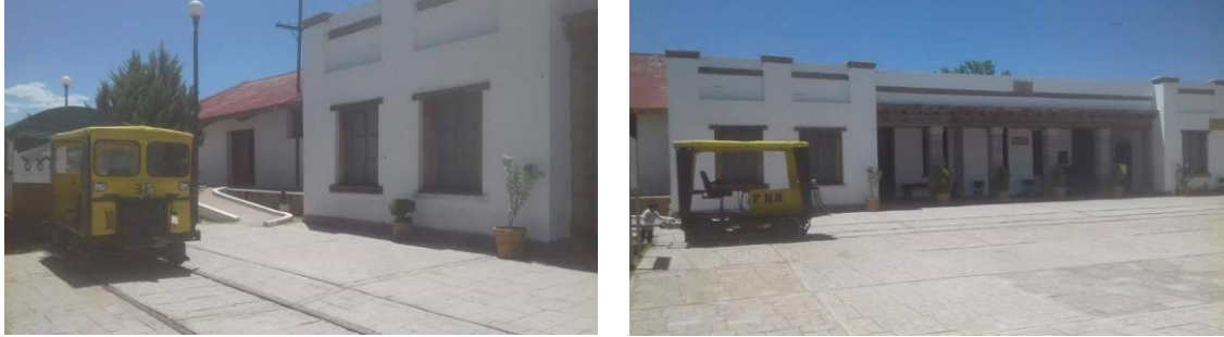
Exterior con los vagones