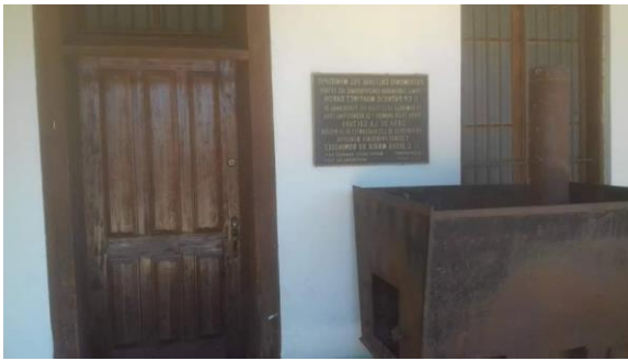
Placa en el exterior de una oficina