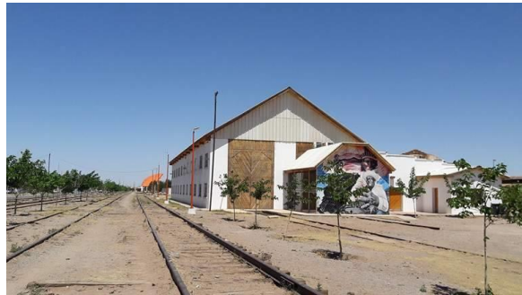
Edificio junto a las vías del ferrocarril