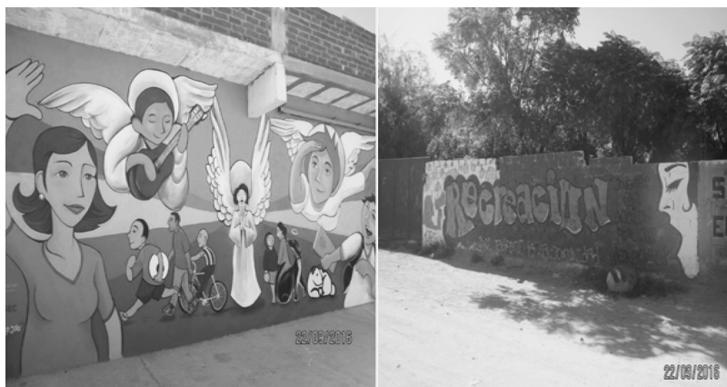
Figura 10-4. El arte: expresión simbólica en la actividad del turismo.