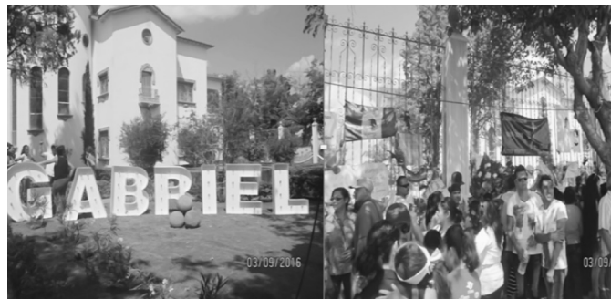
Figura 10-2. El deceso de Juan Gabriel y su impacto en la vida cotidiana de Ciudad Juárez.

Fuente: Ramón Leopoldo Moreno Murrieta (2016). Archivos de trabajo de campo.