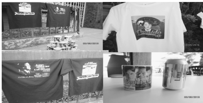
Figura 10-3. Marcas turísticas en el homenaje a Juan Gabriel.