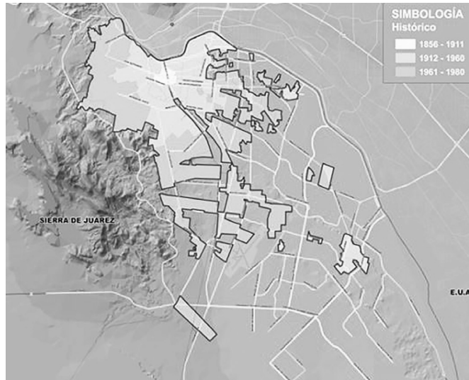
Mapa 10-1. Crecimiento histórico y su relación con el turismo en Ciudad Juárez.