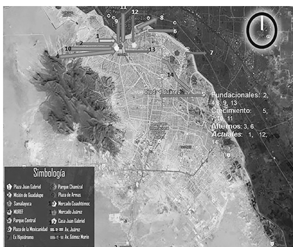
Mapa 10-2. El turismo en Ciudad Juárez.