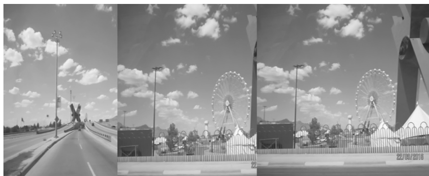
Figura 10-1. Feria colectiva en Plaza de la Mexicanidad, un insumo para el turismo.