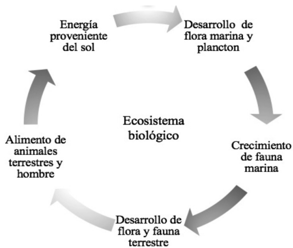
Figura 1. Ejemplo de ecosistema biológico

pueden observar aspectos esenciales en su comportamiento: interacción y compromiso, balance, dominio, acoplamiento y autoorganización.