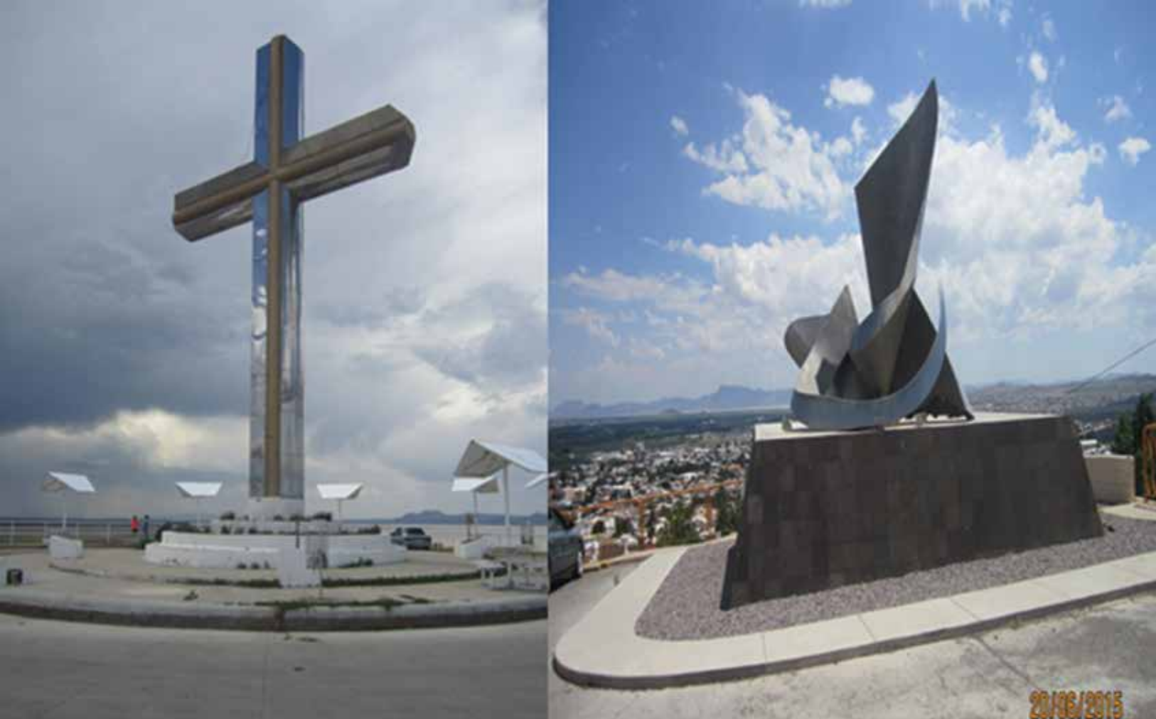
Figura 8. Elementos Simbólicos en la vida urbana de Cuauhtémoc.

conduce a los residentes a establecer mecanismos de recepción de esa acción comunicativa. La figura 7 presenta para el caso de Juárez una muestra del mensaje urbano a través del arte y la escritura donde se plasma la intención de esa visión, el imaginario surge para determinar ese propósito o intención, en el caso de Cuauhtémoc, la visibilidad del mismo, se representa para este estudio como parte del uso, prácticas y formas de entender el emblema del lugar, en relación a la vida cotidiana que se genera en esa ciudad, la práctica religiosa (foto A, figura 8) y el arte urbano (Foto B, figura 8) manifiestan dos momentos significativos en el habitar y su relación con el territorio y los imaginarios en los cuales los habitantes incluyen su valor y cualidades que le dan al lugar un espacio significativo y por tanto expresión de pensamientos y formas culturales de apropiar y ocupar el territorio, las imágenes tanto 7 como 8 son muestra de estos elementos al que se hace referencia.