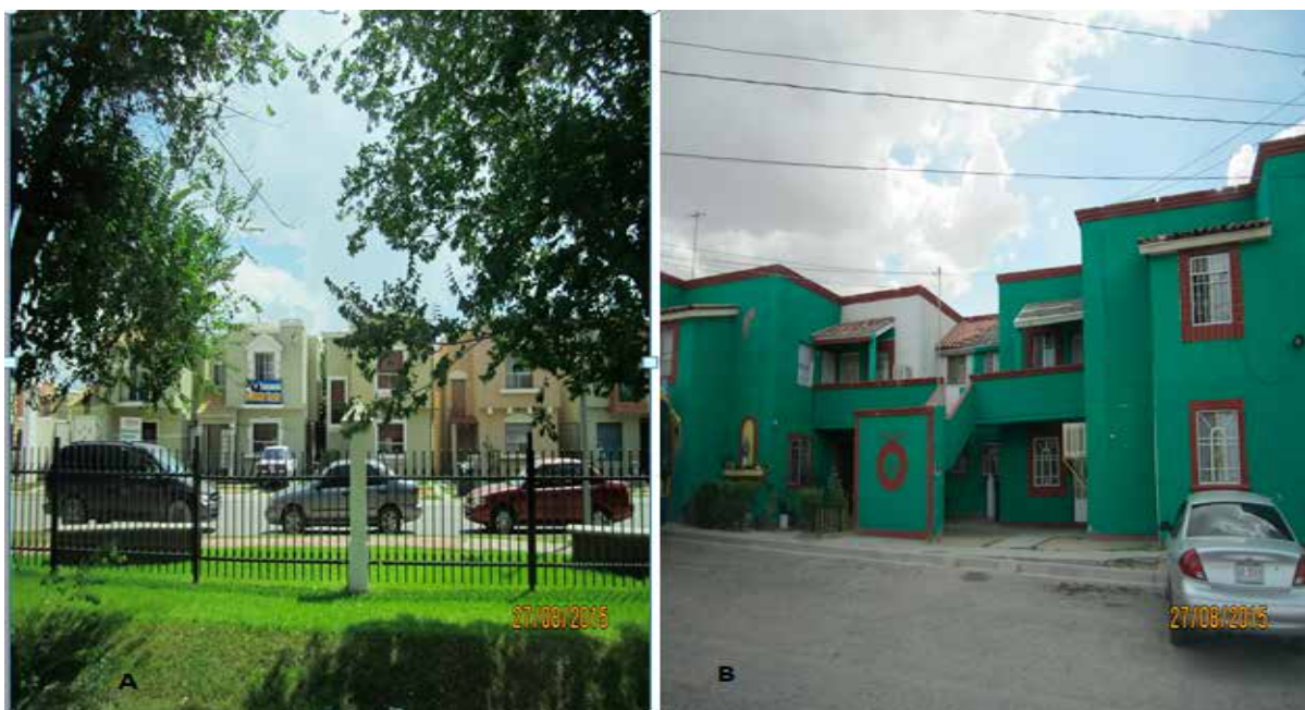
Figura 5. Habitar y vivienda en Ciudad Juárez

Por su parte la figura 6. Da muestra a dos modelos de vivienda en Cuauhtémoc, muy semejantes al que ocurre en Ciudad Juárez, el imaginario y el habitar son procesos que surgen en las manera en que sus habitantes, aceptan estos modelos de vivienda y sobre todo van creando perspectivas específicas, primero como grupo familiar y en segundo como parte del entorno que se va diseñando para las ciudades. En el caso de las fotos A y B de Cuauhtémoc, el título de los conjuntos habitacionales: Los Trigales y la Ciudadela, parecieran indicar algo emblemático en relación al territorio de esta ciudad chihuahuense,