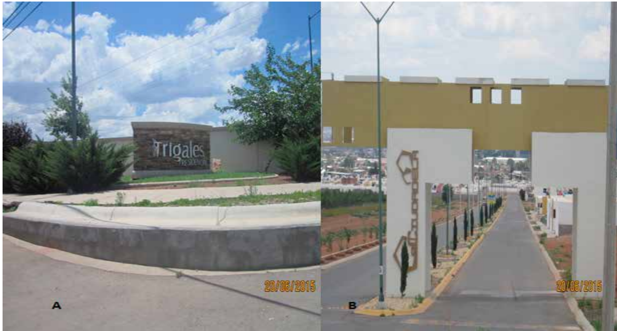
Figura 6. Elementos simbólicos del habitar y la vivienda en Cuauhtémoc.

sobre todo si se hace la respectiva connotación de cómo se vinculan a la dinámica urbana de la ciudad, así los trigales a un valle donde el símbolo representativo es este tipo de cultivo, para indicar, la belleza, esplendor y la majestuosidad del trigo, mientras que la ciudadela, es la representación de un conjunto habitacional de interés social y de clase media, para poder crear un significado a un tipo específico de acción colectiva en la que se desprende distintas formas de pensamiento entre sus habitantes, esto se muestra en la figura 6. Para Juárez, Antara y Eco 2000, son dos significados distintos, ahí las condiciones de la vida cotidiana se ve reflejada en el territorio físico donde se asientan y además reflexionar en las particularidades específicas que se detonan en ambos nombres de estos conjuntos habitacionales que se incluyen en la figura 5.