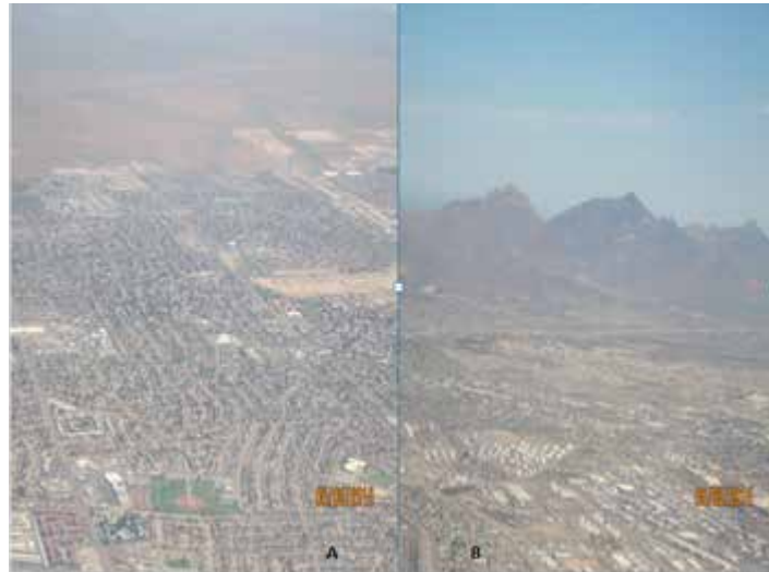
Figura 1. El territorio en Ciudad Juárez: muestras de las áreas oriente y sur poniente

En la figura 2, en las fotos A y B, muestran otra parte de la zona urbana de Ciudad Juárez, el territorio se vuelve más complejo con la incorporación de nuevos asentamientos urbanos y además de la inserción de distintos tipos de vivienda en la cual grupos medios y altos