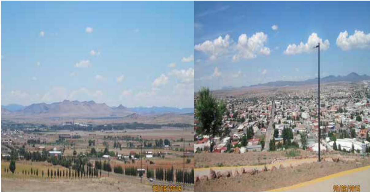
Figura 3. Forma Urbana en Ciudad Cuauhtémoc.