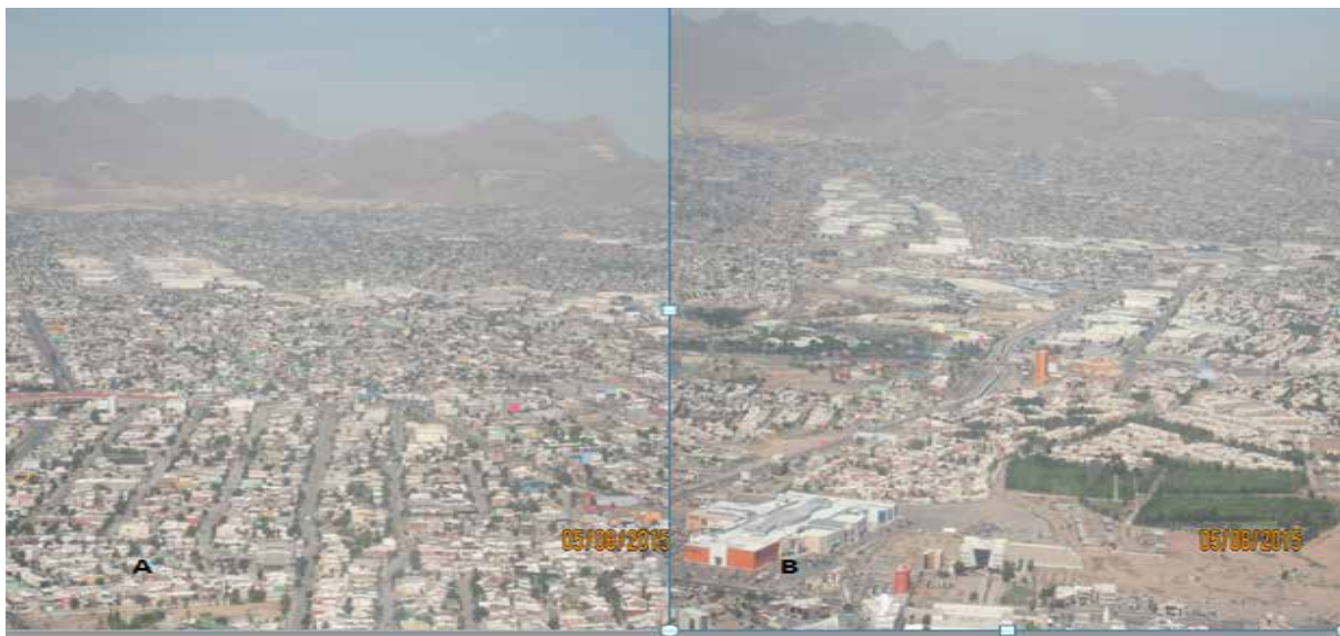
Figura 2. Territorio Urbano en Juárez Chihuahua