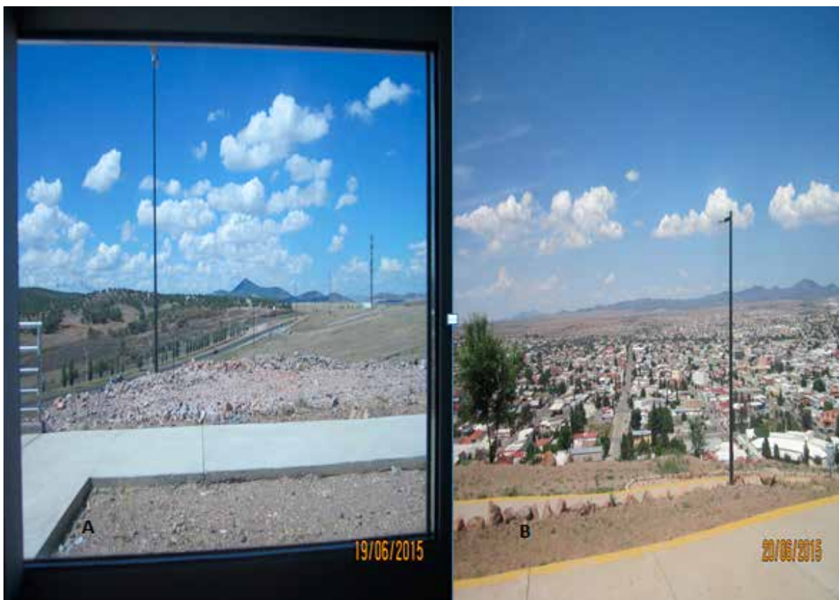
Figura 4. El Valle y la Ciudad: expresiones del habitar y los imaginarios en Cuauhtémoc.