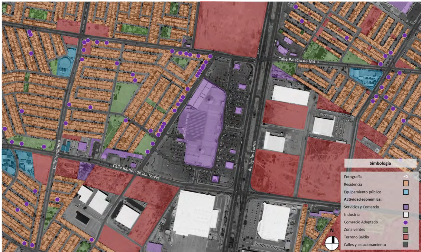
Figura 63. Plano de usos de suelo en el corredor donde se ubica la plaza Sendero Las Torres.