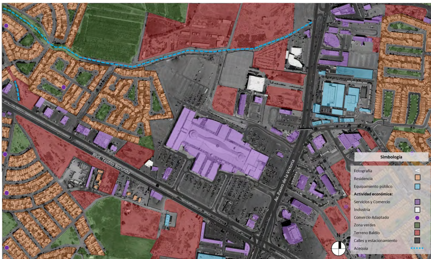
Figura 62. Plano de usos de suelo en el corredor donde se ubica la plaza Las Misiones.

FUENTE: Elaboración propia. Coautoría de apoyo: Diana Jhannel Téllez Moreno.