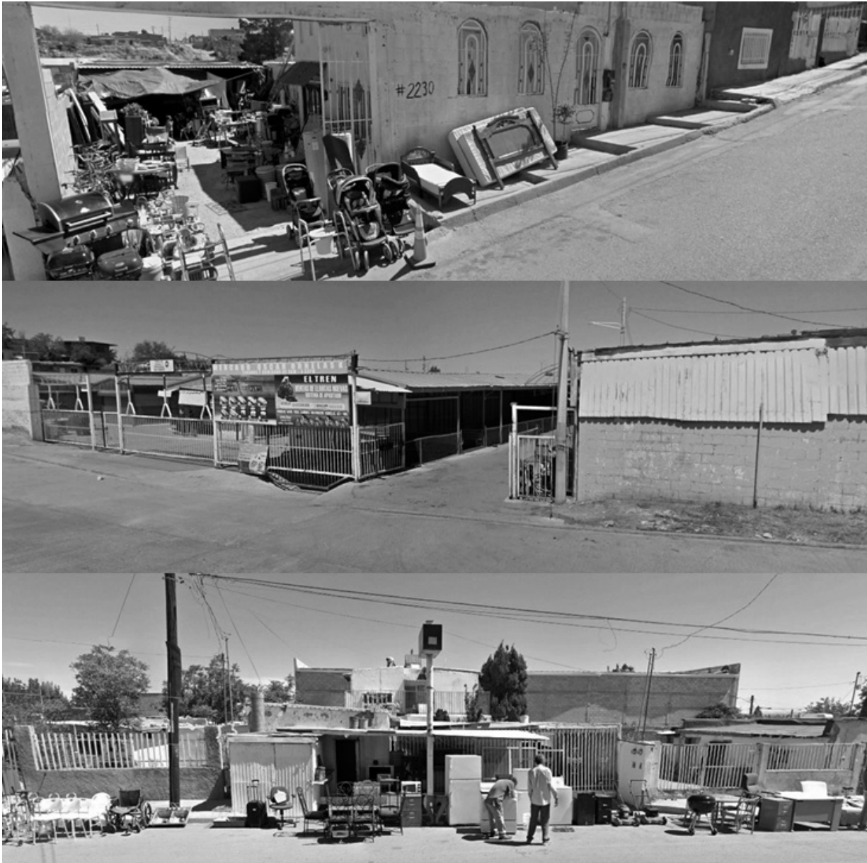
Figura 65. Imágenes de comercios de segundas en Ciudad Juárez. Imagen superior: Calle Nahoas 2230, comercio de segundas Mary. Imagen central: Calle Toltecas 6336, entrada principal al mercado de segundas El Hoyo. Imagen inferior: Calle Centeno 7220, vista frontal de comercio de segundas Muñoz.