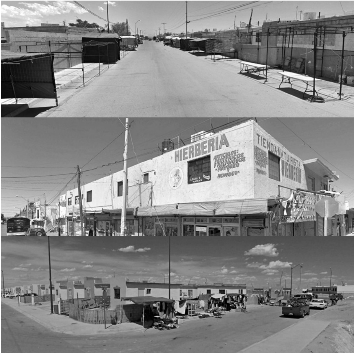
Figura 66. Imágenes de comercios de segundas en Ciudad Juárez. Imagen superior: Calle Claudio de Lorena 525, en segundas De La Lucero. Imagen central: Calle Pera, tiendas al frente de segundas Ramón Rayón y Lucero. Imagen inferior: Calle Melocactus 3514, comercio de segundas Finca Bonita.