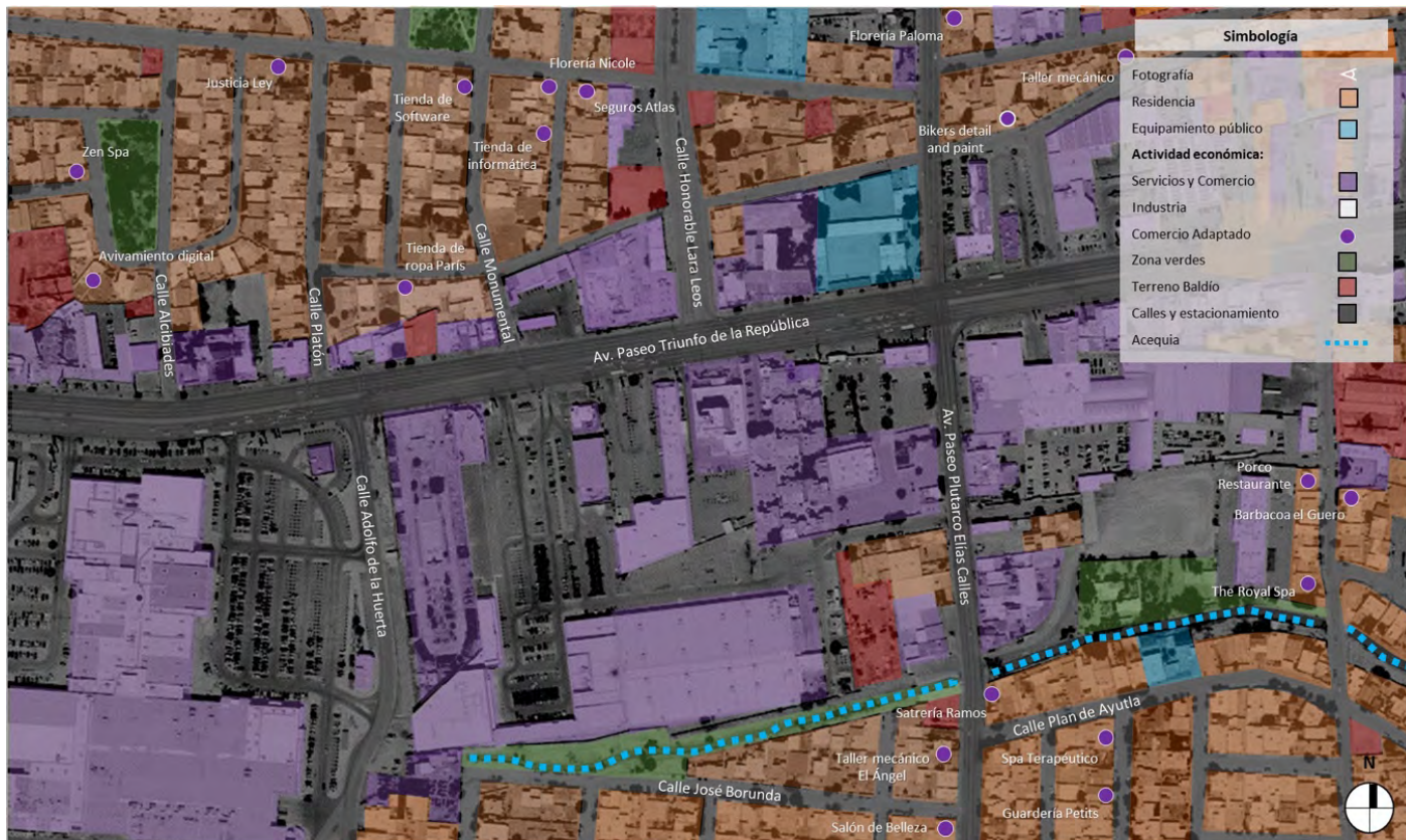
Figura 61. Plano de usos de suelo en el corredor donde se ubica la plaza Monumental.

FUENTE: Elaboración propia. Coautoría de apoyo: Diana Jhannel Téllez Moreno.