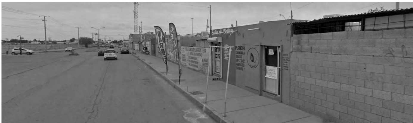
Figura 59. Fotografía de comercio adaptado en corredor urbano. Calle Praderas del Olmo, colonia Praderas de los Álamos, Ciudad Juárez.

planificación formal, pero no les da forma y en su lugar se construye otra realidad.