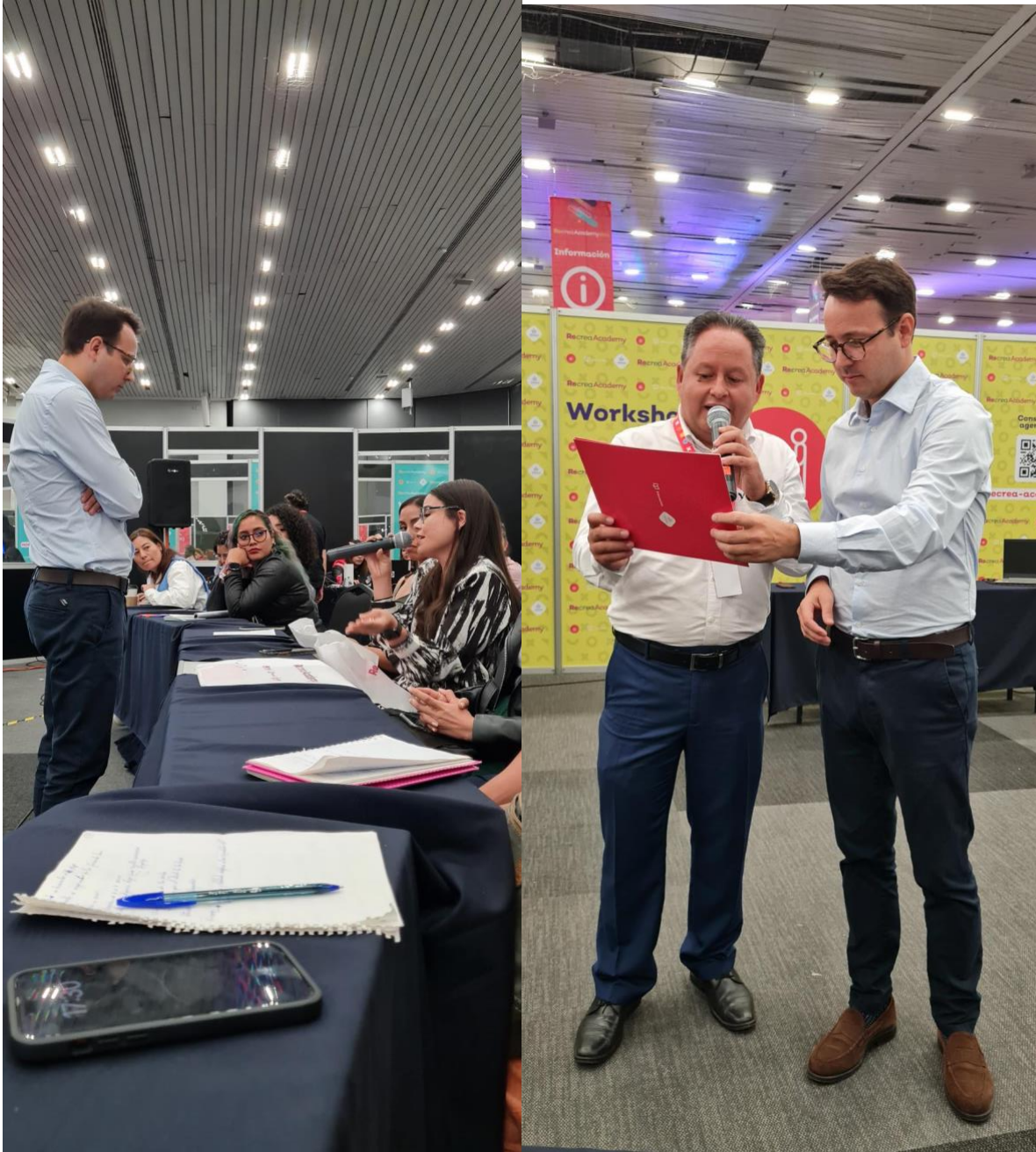
Secretario de Educación Especial del Estado de Jalisco.