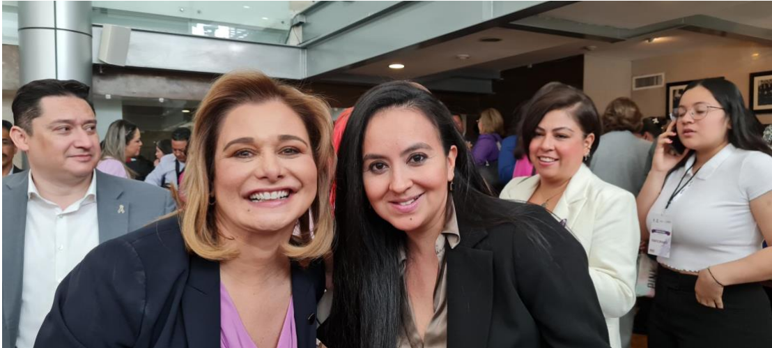
Gobernadora del Estado de Chihuahua. Lic. Maria Eugenia Campos Sesión en el Congreso del Estado.