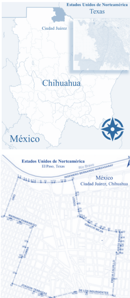
Figura 1. Ubicación y polígono del Centro Histórico de Ciudad Juárez, Chihuahua