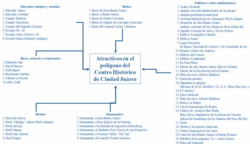
Figura 2. Elementos atrayentes del polígono histórico