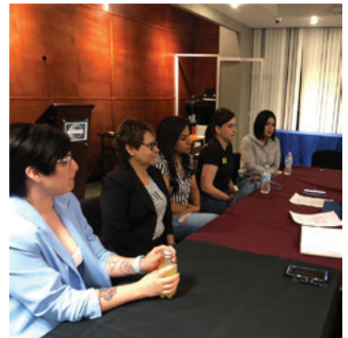
Figura 1. Entrevista a algunas de las integrantes del CODI.