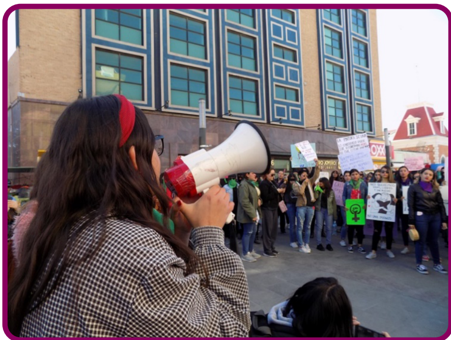
Figura 1. Performance “Un violador en tu camino” en el centro histórico de Ciudad Juárez, diciembre de 2019.