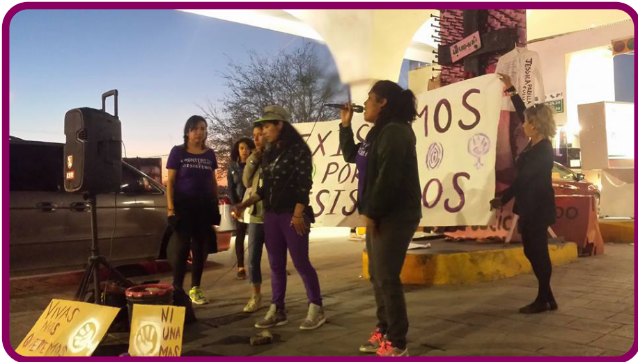
Figura 5. La cruz de clavos, en evento musical con Batallones Femeninos en la entrada del Puente Internacional Paso del Norte. Marcha del día de las mujeres, 8 de marzo de 2017.