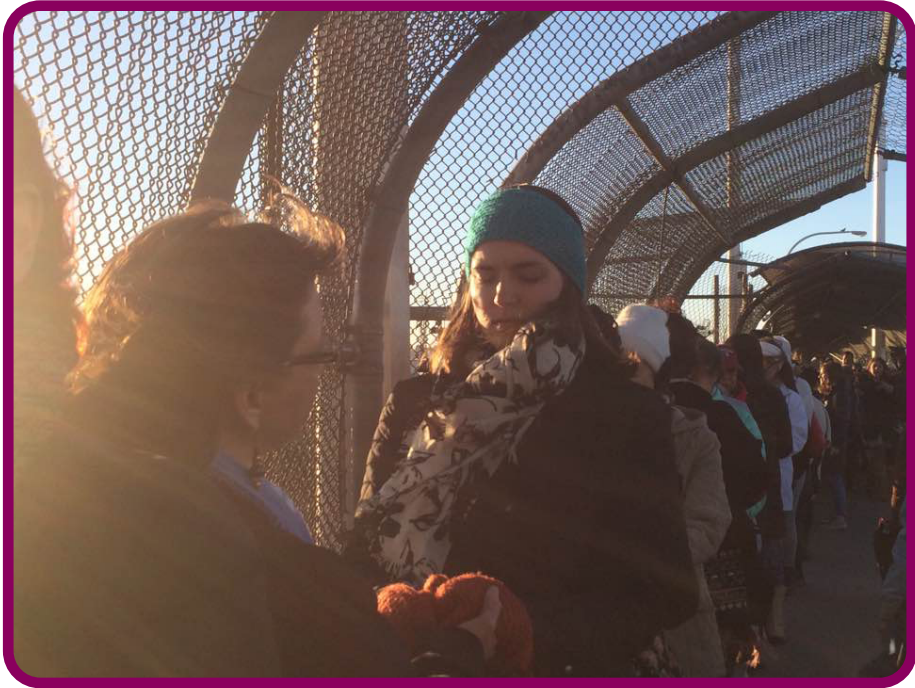
Figura 7. Performance en lo alto del Puente Internacional Stanton, “Trenzando Fronteras”.