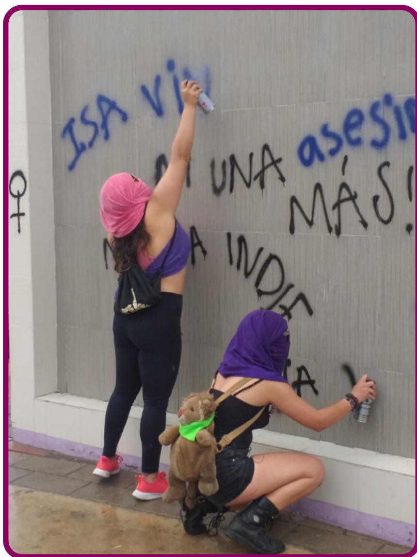
Figura 9. Pinta realizada por dos mujeres en la marcha del día de las mujeres, plaza del Periodista a una cuadra del monumento Benito Juárez, 8 de marzo de 2020.