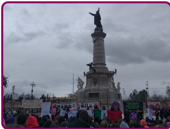
Figura 8. Marcha del día de las mujeres, 8 de marzo de 2020 en el monumento Benito Juárez.

Se puede decir que la importancia del Monumento a Benito Juárez recae en todo lo que representa para el pueblo de México, el contexto de su creación, la figura política de Benito Juárez García, así como la de Porfirio Díaz, encargado de llevar a cabo la obra monumental (Martínez, 2016).