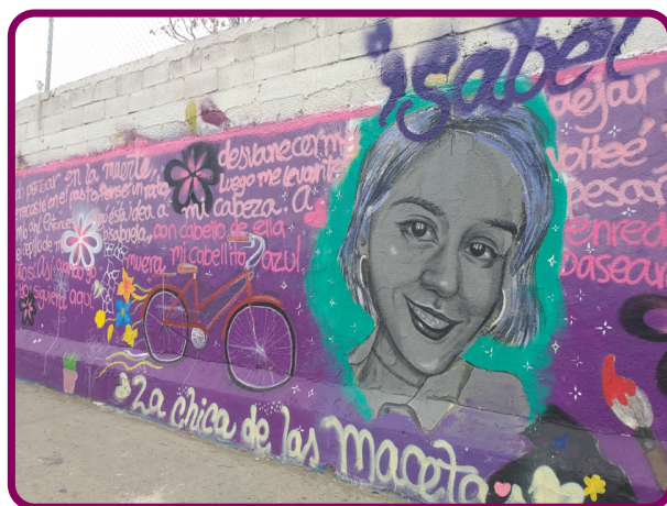
Figura 10. Mural participativo La chica de las macetas , colocado en una barda enfrente del monumento Benito Juárez, organizado por Bravas Colectiva. Marzo de 2020.