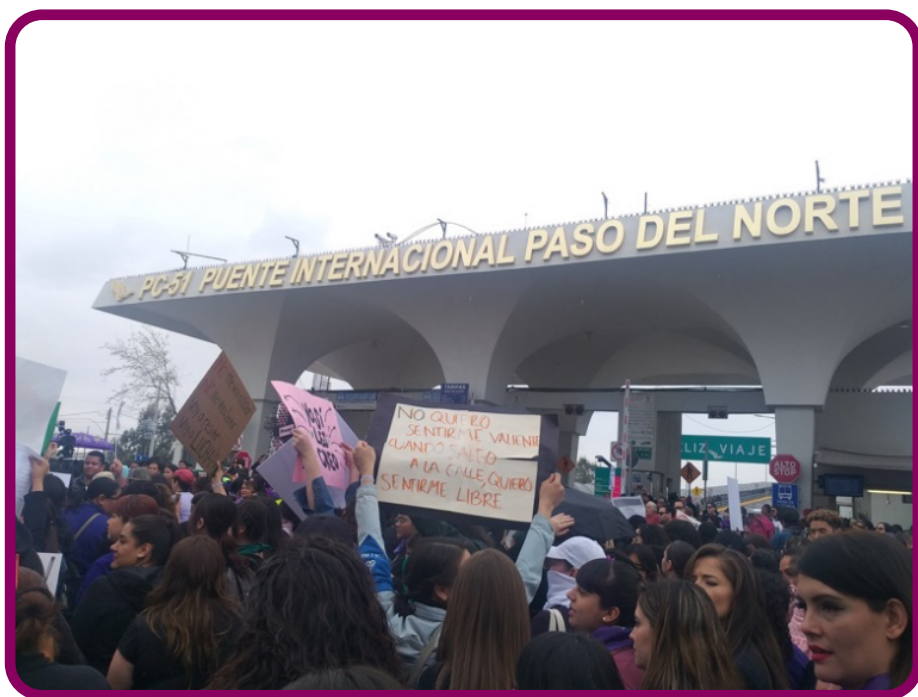
Figura 4. Entrada del Puente Internacional Paso del Norte, en la marcha del Día de las Mujeres, en marzo de 2020.

Otro espacio que es relevante al hablar de las manifestaciones de las mujeres en la frontera es la zona de cruce, que también se encuentra conectada con el centro histórico de la ciudad, y que por la avenida Juárez se enlaza a su ciudad hermana ( sister city ) El Paso, Texas. Aquí físicamente se eleva el Puente Internacional Paso del Norte y el Puente Stanton. Los puentes internacionales crean a la par un sector relevante al hablar de acciones públicas de artistas y activistas (Figura 4).