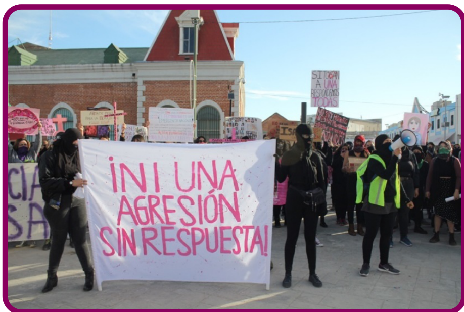
Figura 2. Marcha y protesta para demandar justicia por el asesinato de la activista y artista Isabel Cabanillas ocurrido el 18 de enero en Ciudad Juárez.

Fuente: Fotografía de Favia Lucero, tomada el 25 enero de 2020.