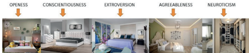
Imagen 2. Ejemplo de análisis en función a elementos en el espacio.