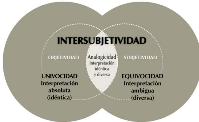
Imagen 4. Esquema de la interpretación en la hermenéutica analógica de Beuchot.