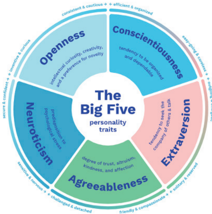
Imagen 1. Modelo OCEAN.

Dicho modelo se retomará de manera posterior al establecer la relación entre los espacios que habitan los individuos y los análisis que de éstos