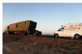
Carreterazo en la Jiménez-Gómez Palacio deja 3 muertos