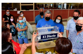
Regala El Diario de Chihuahua 26 boletos para el Palanque

El agua no es negocio, ni política, mucho menos propiedad, debemos comprender que el agua representa vida para todos, por ello todos tenemos derecho a su consumo, pero también tenemos la responsabilidad de su cuidado, solo de nosotros depende.