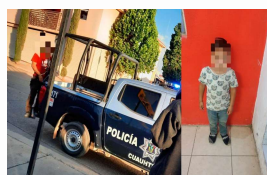
Por falta de denuncias dejan en libertad a exhibicionista