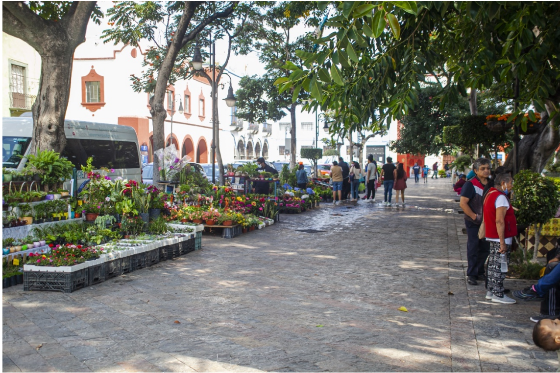
Figura 5. ESCENIFICACIÓN FLORÍSTICA DEL ZOCALO DE ATLIXCO.

De acuerdo a los resultados que proporcionó el muestreo de los turistas, es interesante que los visitantes mencionaron su intención de acudir a otros lugares que no pertenecen ni a la ciudad ni al municipio de Atlixco, como los exconventos de Tochimilco y Huaquechula; la zona arqueológica de Cholula y el atractivo de Chipilo, por su historia de migración italiana de la región Véneto a finales del siglo XIX, así como su producción de lácteos. Lo anterior implica que Atlixco usufructúa la riqueza cultural de estas localidades al ofrecer los servicios de zonas de restaurantes, área de viveros y hoteles, incluido el alojamiento de Airb&b.