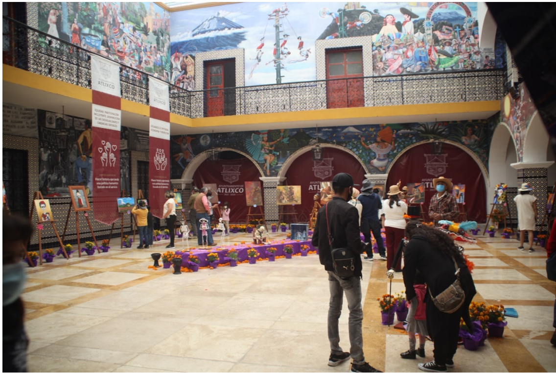
Figura. 6. REPRESENTACIONES TURISTICAS EN ATLIXCO, (Fuente: Jesús Bautista, 2021)