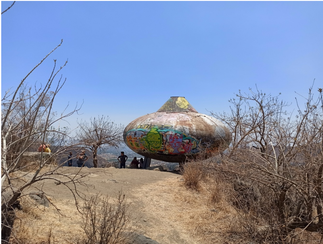
Figura 3. ESCULTURA DEL OVNI EN MEPETEC, ATLIXCO.

Las actividades que realizaron los visitantes fueron pasear por el centro, comer, así como recorrer la zona de viveros y comprar plantas en el zócalo, e incluso visitar el OVNI (Figura 3), una escultura localizada en la localidad de Metepec. El interés por conocer el rico patrimonio cultural de Atlixco es mencionado de forma general y en ocasiones se hace alusión de manera muy general al Ex - Convento Franciscano y la Parroquia de la divina infantita, pero sin algún dato relevante que refleje su interés o reconocimiento sobre la importancia de estas edificaciones.