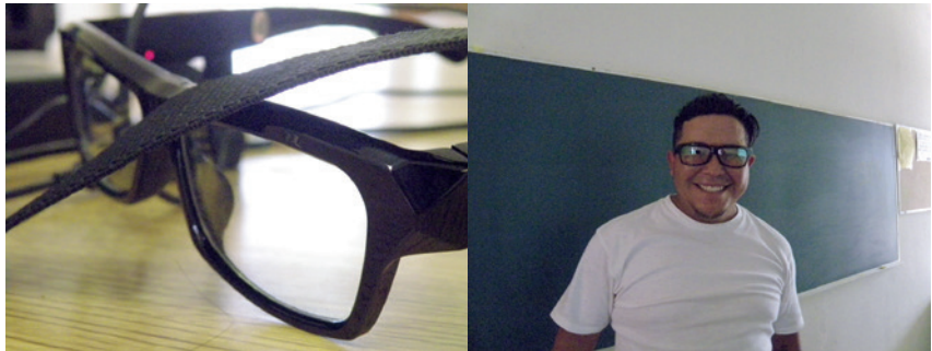
Figuras 3 y 4. Dispositivos utilizados para la recopilación de información a través de video.