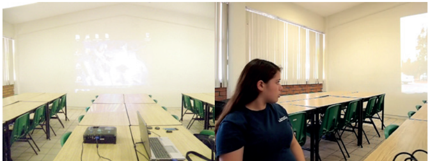
Figuras 4 y 5. Desarrollo de las entrevistas/retrato por parte de los participantes del proyecto.