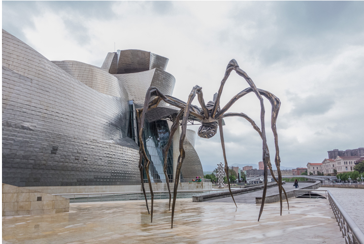
Figura 6. Louise Bourgeois, Maman (1999) Mármol, Acero inoxidable, Bronce. 100 x 100 cm. Ubicación: Museo Guggenheim, Bilbao.

El tejido de la araña es curativo, y por tanto su efigie se convierte en símbolo que reconcilia y sana, donde el hilo traza para constituir una estética de la reparación. Sin embargo, la araña como metáfora de una maternidad, implica tanto una gestante como una depredadora que, al tejer infinitamente, (re)crea infatigablemente su propio hogar que, a la vez, es un espacio destinado a la muerte y a la constante regeneración y reconstrucción de lo dilacerado. Bourgeois no solo relaciona en ella conceptos como el amparo con el dolor, el cuidado con el desgarrar, sino que –dentro de esta conexión entre el sufrimiento y la memoria– la confina conceptualmente en la confección interminable como función catártica, como aquella que no puede parar de hilar. En este sentido, nos recuerda al sudario que Penélope destejía de noche para, perpetuamente, deshacer aquello que tejía de día, y postergar así el momento de sustituir a Ulises como esposo, algo que advierte –como vimos con las Moiras– a la terrible condena que encierra el poder de manejar el tiempo, el destino y la creación; el dolor que conlleva entretejer la vida, el llevar de algún modo, el cadáver de nuestras memorias a cuestras.