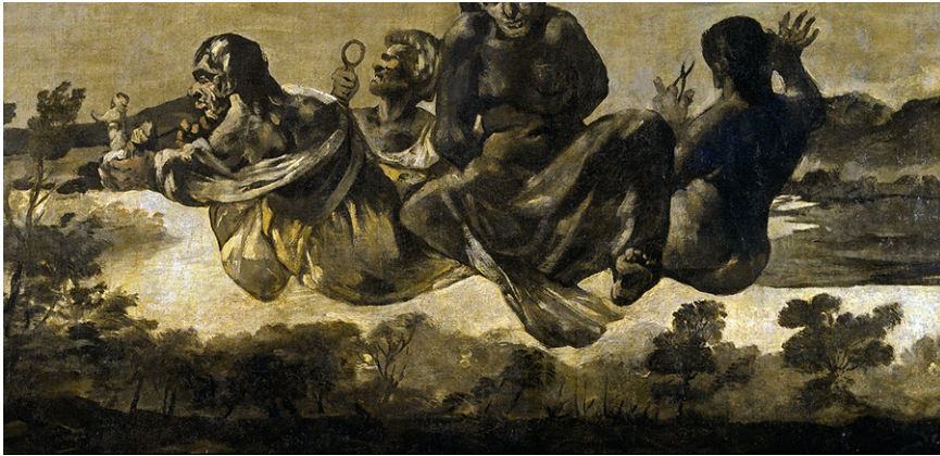
Figura 1. Francisco de Goya y Lucientes. Átropos , (1819-1823). Óleo sobre muro al seco. Dimensiones: 123 x 266 cm. Museo del Prado. Madrid. Imagen de Dominio Público.