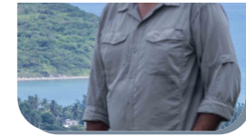
López Vocal Sur