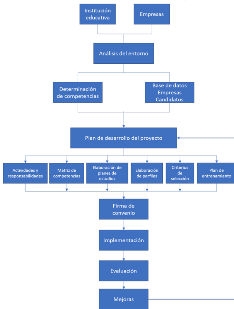
Figura 3. Diagrama de desarrollo del proyecto