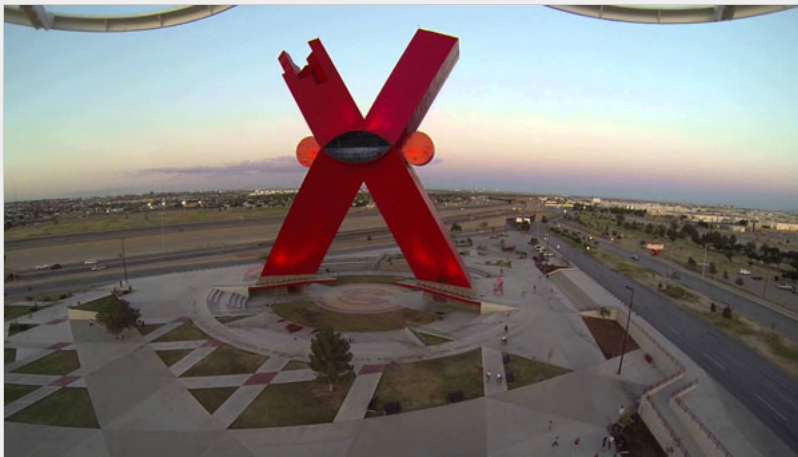
Imagen 4. https://static.wixstatic.com