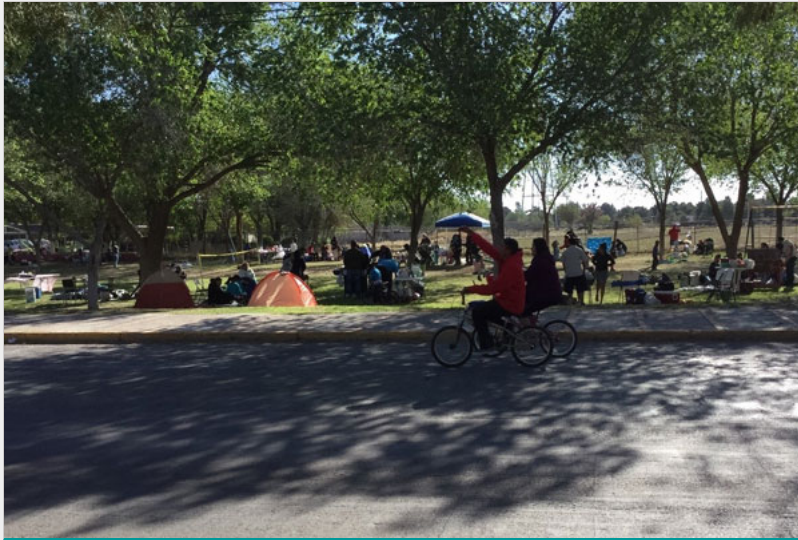
Imagen 3.

En lo referente a Chamizal National Memorial lo visible es que, desde su instauración, este espacio estuvo dispuesto para ser un como menciona Brooks “emblema de sitio de la exaltación a la amistad entre EE.UU. y México resurgida en la década de 1960” (2019), pero con pocas miras a convertirse en un enlace social transcultural fronterizo, en sí es un espacio de transición entre una frontera y otra, un borde que señala y hace plausible la división de dos naciones.