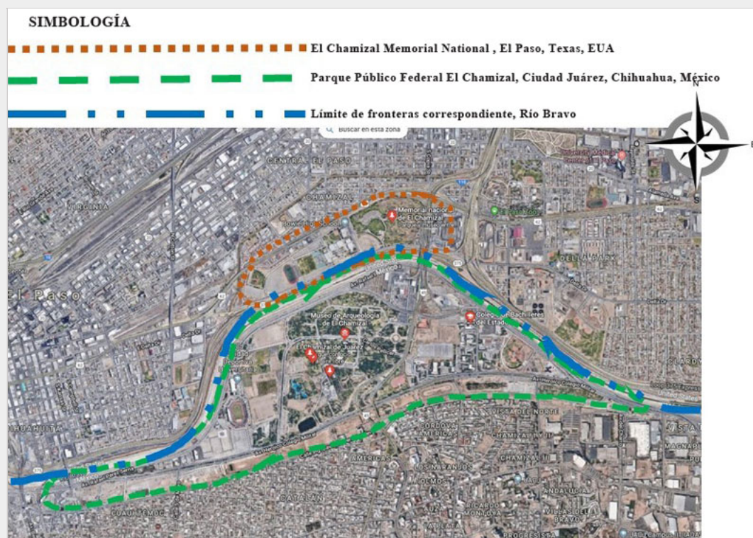
Imagen 1. Esquema relativo a la ubicación de la zona conocida como El Chamizal, México–Estados Unidos de Norteamérica.

que los terrenos recuperados se dedicarían exclusivamente para fines recreativos (Imagen 1). Además, se construyó un canal revestido con concreto para albergar el cauce del río y evitar en lo sucesivo este tipo de conflictos (González de la Vara & Siller, 2006, pág. 114).