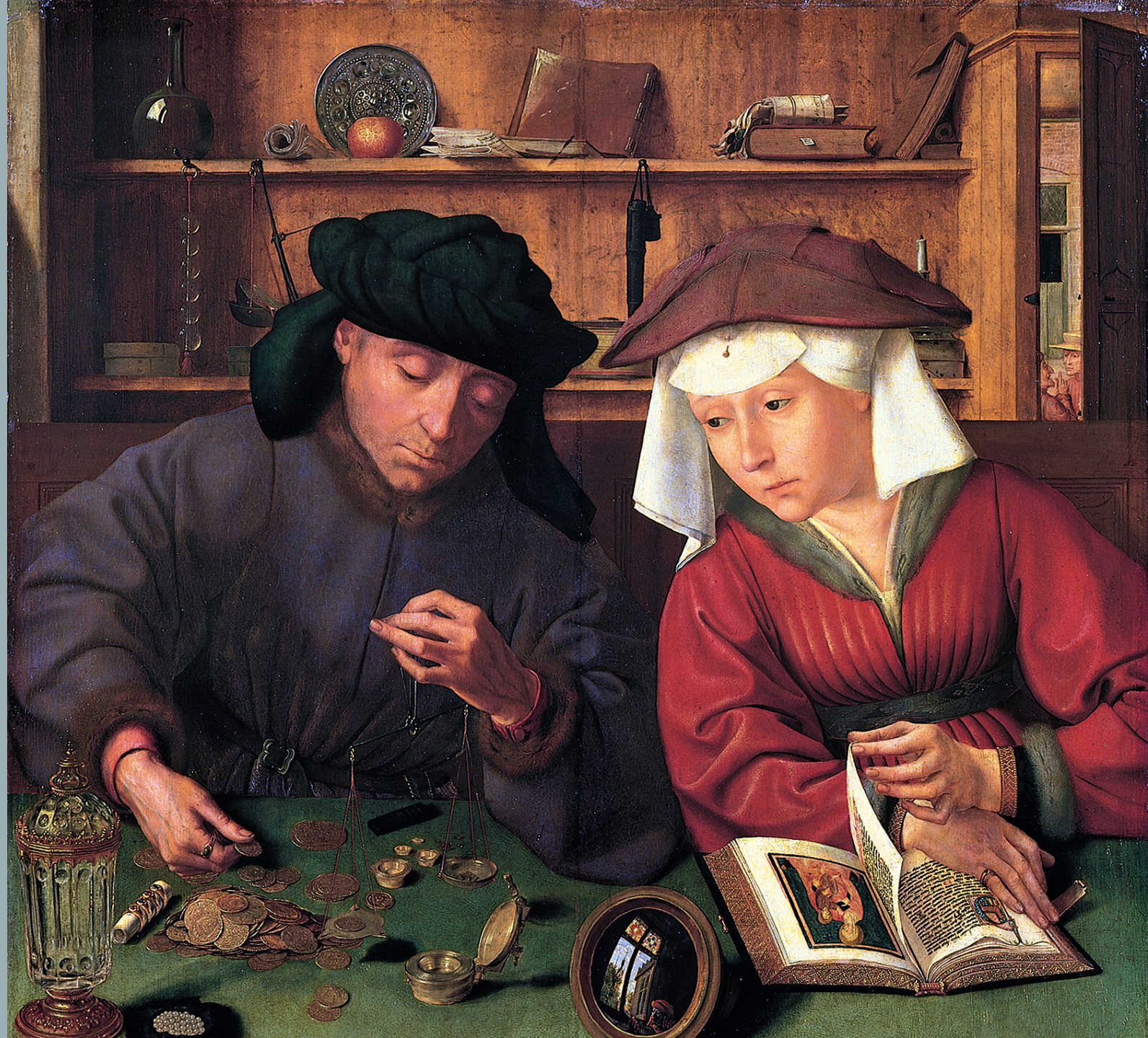
“El cambista y su mujer” Quentin Massys, 1514.