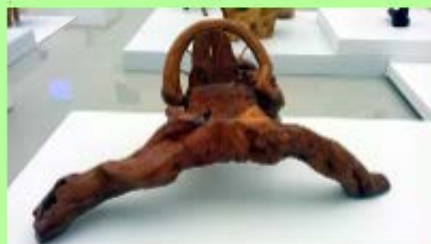
Una de las piezas de la exposición.